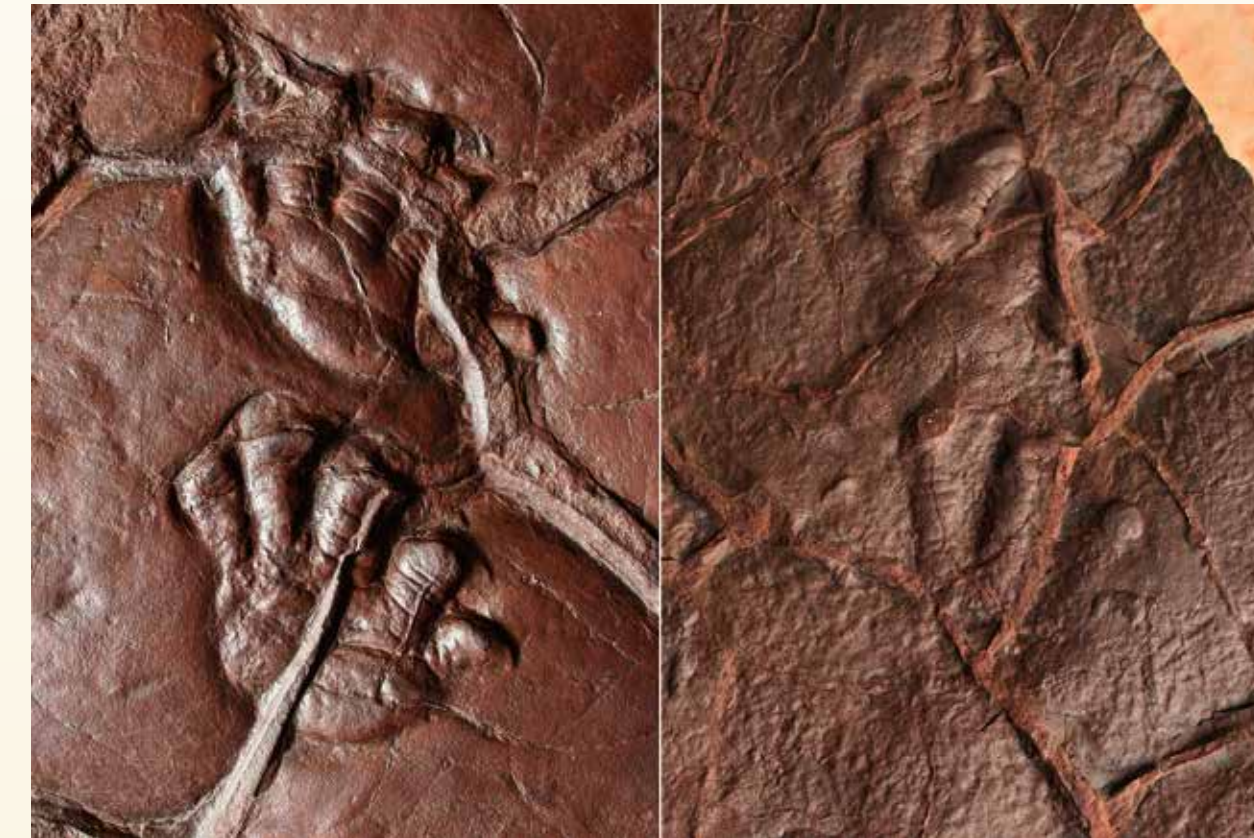
Abb. 2: „verschlammte“, perfekte und flache Abdrücke von Ichniotherium sphaerodactylum (PABST 1895). Die Tiefe der Abdrücke ist abhängig von der Konsistenz des Untergrundes.

Ein weiteres Problem ist, dass unterschiedliche Tiere durch ähnliches Verhalten auch ähnliche Spuren erzeugen.