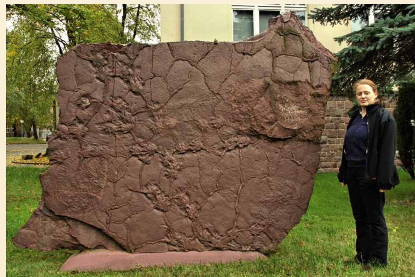
Abb. 1: Megatambichnus ist eine große Wühlspur, die mit der Fährte Ichniotherium sphaerodactylum in Verbindung steht, also vom gleichen Erzeuger stammt.

Durch den Bromacker ist vor 290 Mio. Jahren ein Ursaurier gelaufen. Hinterlassen hat er Hand- und Fußabdrücke, die uns überliefert wurden. Diese versteinerten Spuren sind ganz besondere Fossilien. Sie dokumentieren die Lebenstätigkeit ausgestorbener Tiere und liefern damit Informationen, die Körperfossilien, wie z.B. das erhaltene Skelett eines Sauriers, meist nicht liefern können.