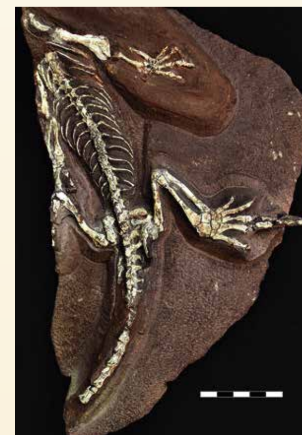
Abb. 1: Cabarzia trostheidei

Ein sehr kleiner Ursaurier ist der salamanderähnliche Georgenthalia clavinasica . Sein Arname weist auf die schlüssellochförmigen Nasenöffnungen hin. Tambachia trogallas war ein räuberisches Amphib. Der Artname leitet sich von „mampfen“ und „Wurst“ (griech. trogo und allas) ab und ist eine Ehrung der Thüringer Bratwurst. Der nur 26 cm lange Eudibamus cursoris ist ein Reptil. Sein Name bedeutet „zweibeiniger Läufer“. Er war ein flinker Insektenjäger, der streckenweise auf zwei Beinen rennen konnte.